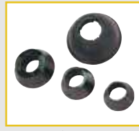
GAR 111 (Ø 44 - 112 mm)