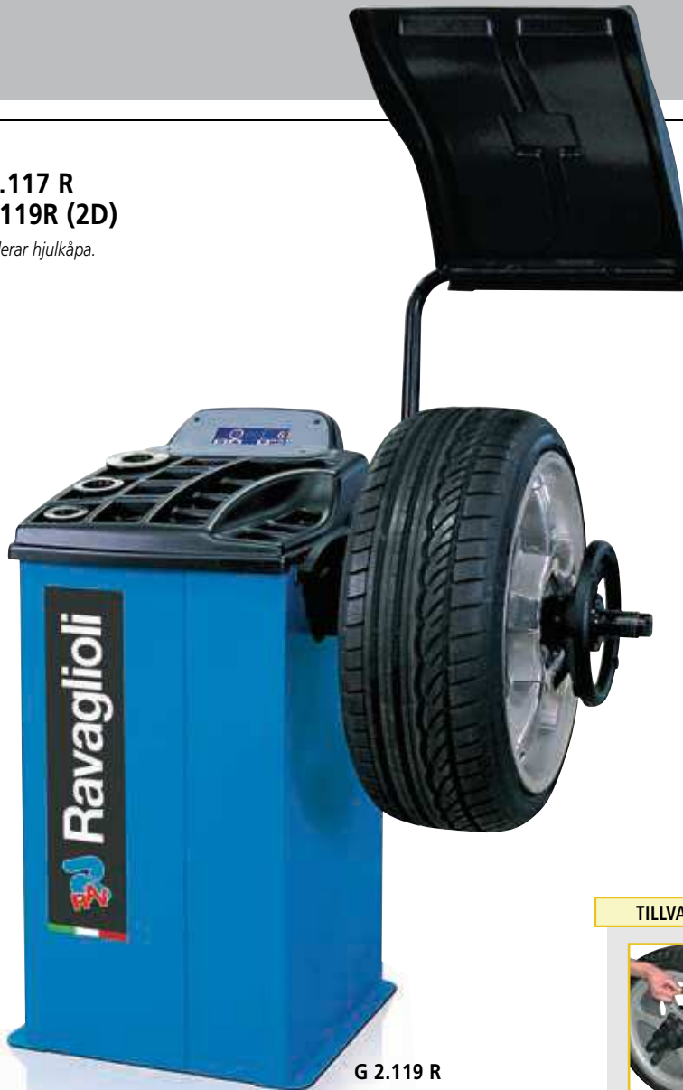
G 2.119 R