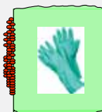
HANDSKEN SKYDDAR 8 TIMMAR