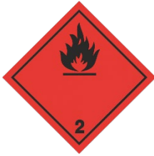
Bild 2. ADR 2.1 symbol.

ADR 2.1 och 2.2 symbolen MÅSTE vara 10x10cm och tåla väderpåfrestningar , detta innebär att en utskriven bild i papper inte duger. Vänligen beställ godkända ADR 2.1 etiketter, exempelvis från följande hemsida: