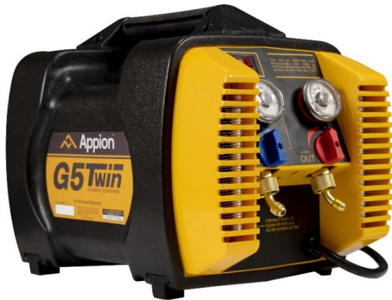
Bild 5. Återtagningspump för köldmedier.