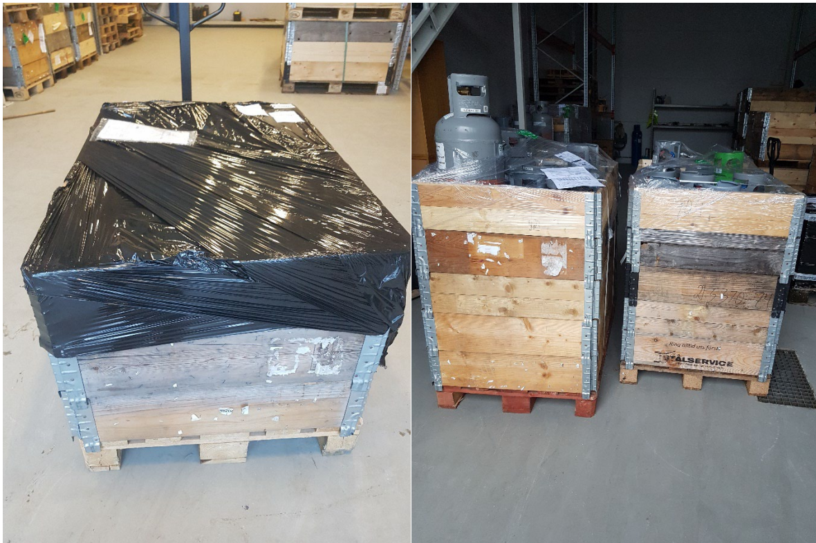
Bild 3. Paketering av returflaskor på pall med kragar, inplastning är inte nödvändigt men rekommenderas.

För att transportera returcylindrar måste dessa av säkerhetsskäl alltid packas på en pall. Vi förutsätter att ni använder er av pallkragar för att underlätta packningen och för att göra sändningen stapelbar (se bild 3.). När ni beställer returcylindrar från oss medföljer alltid en pall med pallkragar.