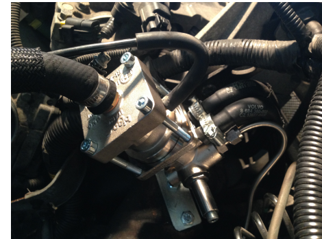
Bigas RI27-JV gasregulator