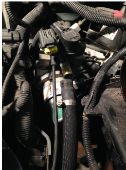
Original NECAM gasregulator