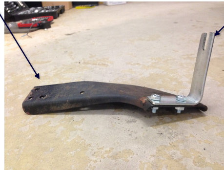
Medföljande fäste för RJ27-V