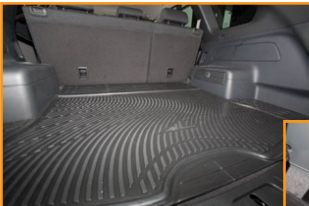
Bagagematta med detaljer som du oftast endast finner på originalmattor

Mattan har ett mönster som matchar de flesta bilars bagageutrymmes design. Mönstret gör det dessutom mycket lätt att själv klippa till mattan så att den exakt passar bagageutrymmets utformning.