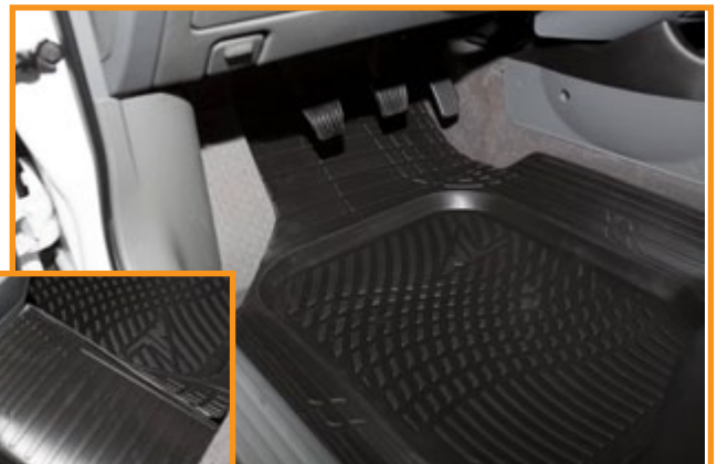
Kupémattan har skålförning som effektivt samlar upp vatten och skräp. Det medför även skydd för kardantunnel bak.