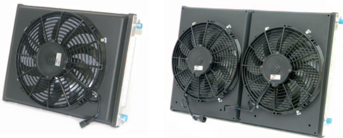
Condensatore HTC elettroventilato, HTC condenser with fans

Condensatore HTC elettroventilato/HTC condenser with fans