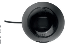
Handenhet och kontrollenhet Interlock® 7000