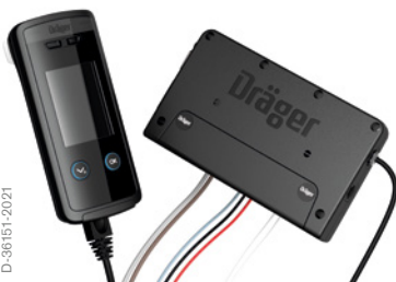
Handenhet och kontrollenhet